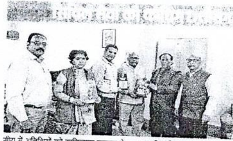
सीयू में अतिथियों को साहित्यिक पुस्तक देकर सम्मानित किया गया।